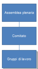
Figura 2: Struttura organizzativa

La Società semplice Terravis è organizzata nel seguente modo